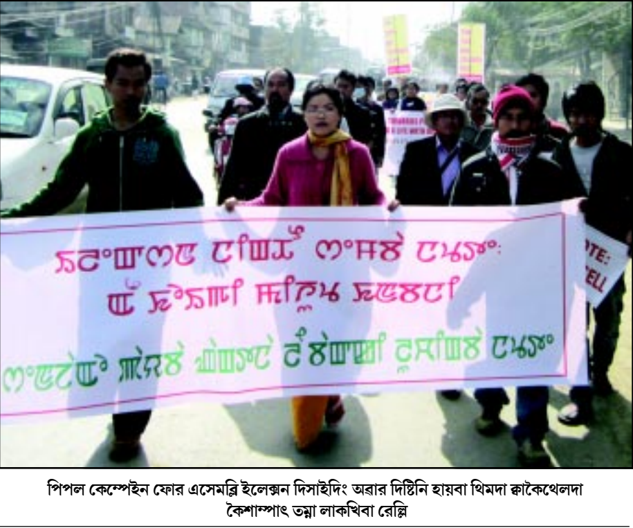
পিপল কেমেপইন ফোর এসেমব্লি ইলেগন দিসাইদিং অৱাৰ দিষ্টিক হায়বা থিমদা কাঁকেথেলদা কেপাংশাং তল্লা লাকখিবা ৱেল্লি