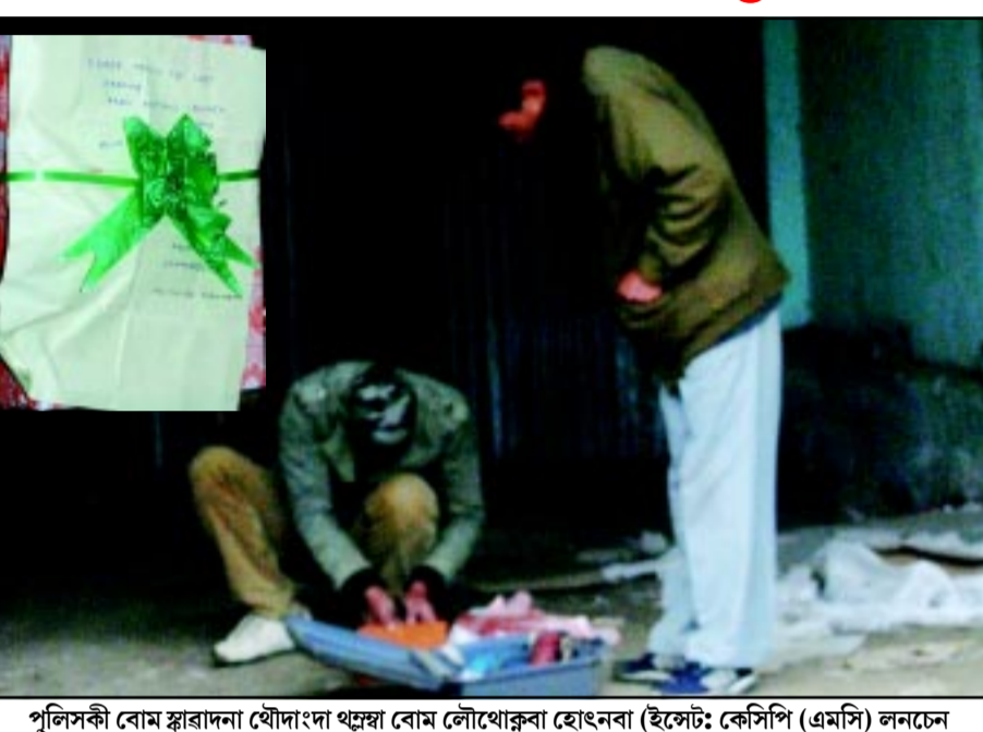
পুলিসকী বোম ক্লাৱাদনা খৌদাংদা থন্নদা বোম লৌথোকুনা হোংবানা (ইস্টেট: কেসিপি (এমসি) লনচেনে চনুনা অনৌবা চহিগী খুদোল ওইনা পীৱগা বোম লৌথোকু।

খৌদাং পাউমীদৰ্গী ইফাল, জানুৱাৰি ২ঃ চহিসিগী অহানবা ওইনা গুসি অযুক পুং ৫ তাবা মতমদা কেসিপি (এমসি) লনচেনে চনুগী কাংবুনা পাউ-চে অসিগী ওফিসতা নিউ ইয়াৰগী খুদোল ওইনা চহিনিজ হেন্দ গ্ৰেনেদে অমা বোজতা হাপ্ৰগা থন্নলে।