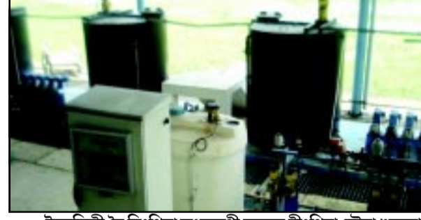
ইলেক্ট্রিক্স মৈ নিংখিনা ফংবদগী ফক্সন মীংখিনা তোবা ওমড্রেবা কাংচুপ বাটার সপ্রাইদা লৈবা ফ্রান্সকী ট্রিটমেন্ট মেছিন

খৌদাঃ পাউমীদগী ইফাল, মে ২৬ঃ মণিপূরদা ইলেক্ট্রিক্স মৈ নিংখিনা নোংমদা পুং ২/৩ থক ফংবনা লুপ জোর কয় চংনা পায়খৎখিবা ফ্রান্সকী বাটার ট্রিটমেন্টকী টেকনোলজিগী মেছিন নিংখিনা ফক্সন তোবা ওমড্রে। ফেল ওইরে।